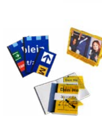
Papier en karton